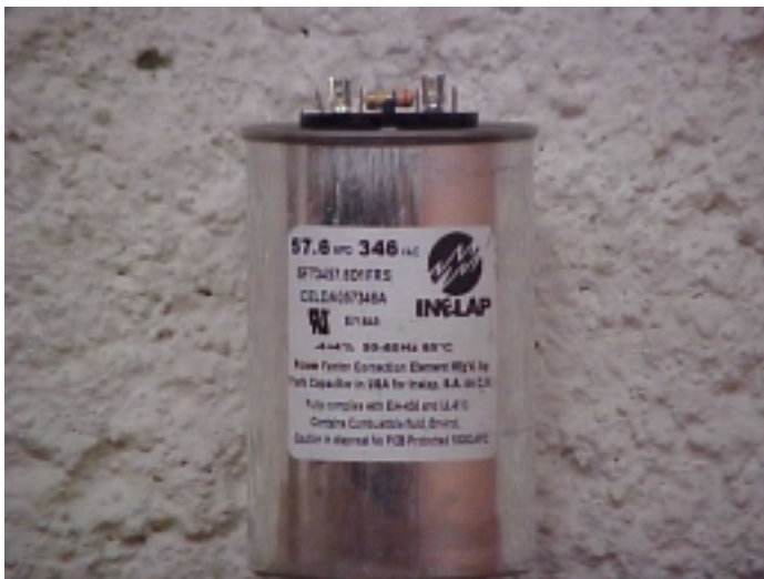
Celda capacitiva con resistencia de descarga

Las celdas capacitivas tienen la aprobación de los laboratorios UL en forma individual y cumplen con las normas ANSI-NEMA y EIA-456. Ésta última requiere que los capacitores sean sometidos 1.25 veces su tensión nominal, a una temperatura de 10 °C arriba de su temperatura de diseño durante 2000 horas y conserven su capacitancia dentro de un rango de \pm 3\% . Esta prueba garantiza una vida del producto por 20 años. A diferencia de la norma IEC que prueba sus unidades a 40 °C por 1000 horas, la norma NEMA garantiza un mejor desempeño de los capacitores. De hecho la norma IEC no permite que la temperatura ambiente sobrepase 40 °C y además esta temperatura no puede conservarse más de 8 horas por cada 24 horas.