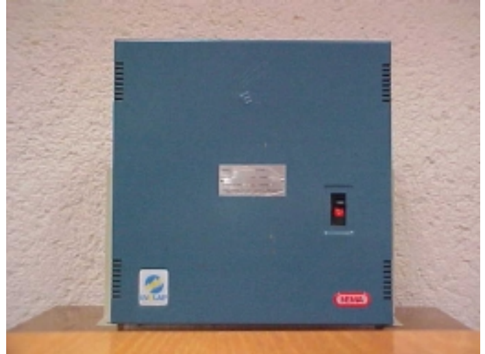
Banco fijo con interruptor para corrección de FP

de sobrecarga o corto circuito. El interruptor termomagnético también tiene la ventaja de permitir la desconexión manual del banco para revisión y mantenimiento.